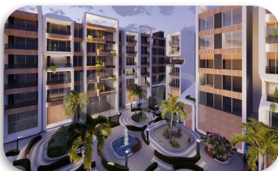
محوطه سازی و نورپردازی نما B و C