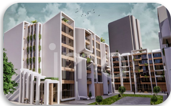
پرسپکتیو بلوک A و C