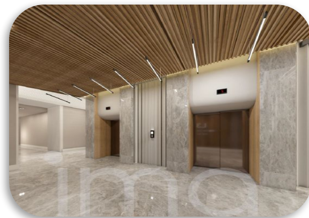
تصاویر واحدهای نمونه اجرا شده: