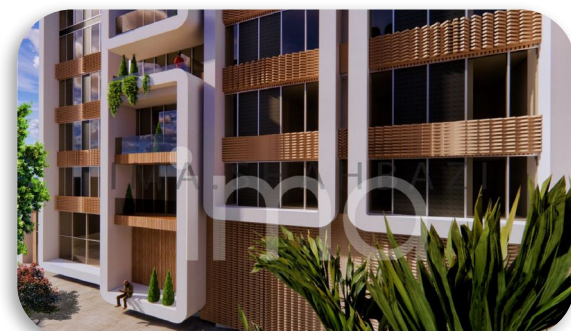
پرسپکتیو بلوک D