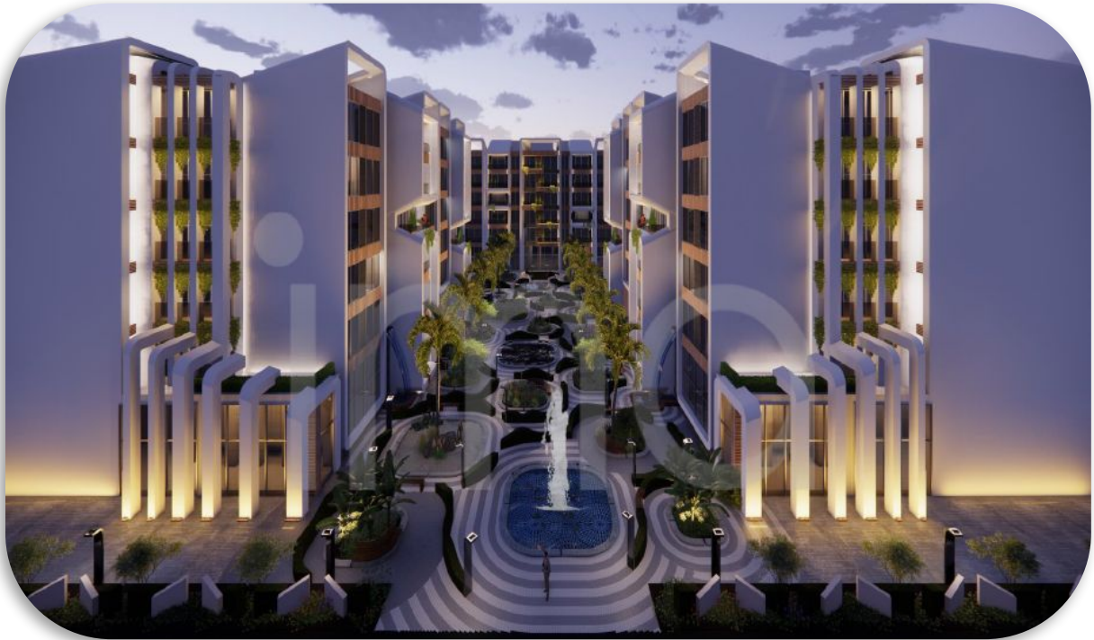
محوطه سازی و نورپردازی نما