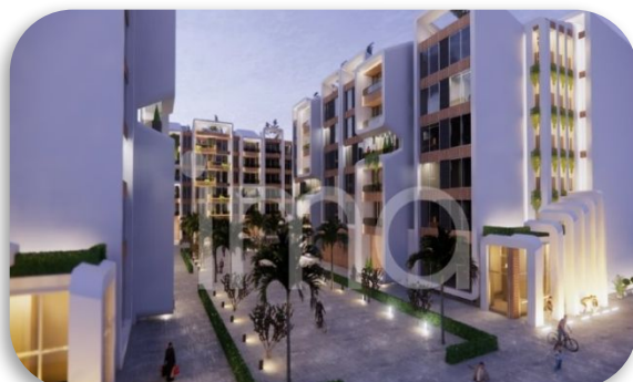
نورپردازی بلوک A